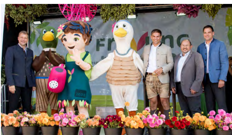
Fahnenübergabe Freyung im Sommer 2023