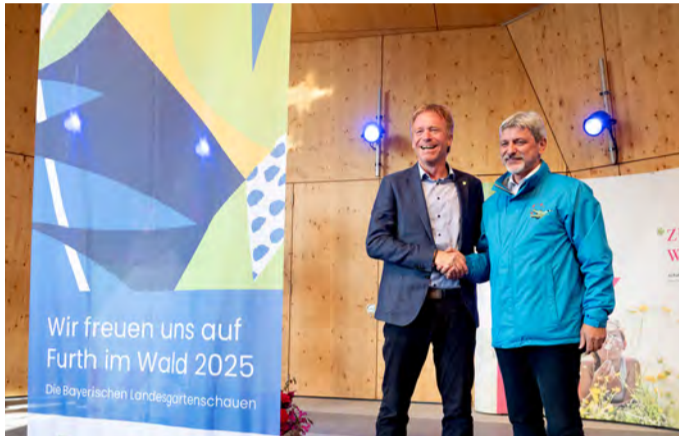
Fahnenübergabe: 2025 findet die Landesgartenschau in Furth im Wald statt.

Am 6. Oktober war der letzte Tag unserer erfolgreichen Landesgartenschau unter dem Motto "Zusammen.Wachsen". Es bleibt der neue mehr als 10 Hektar große, üppig bepflanzte Ortspark, von dem das soziale Leben der Gemeinde nachhaltig profitieren wird. Wir freuen uns schon auf die nächste Gartenschau 2025 in Furth im Wald.