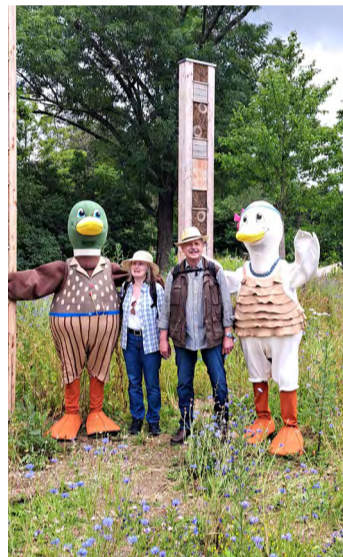
200.000 Besucher Anfang Juli