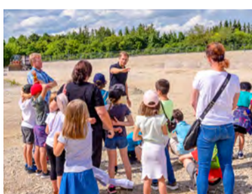
Baustellenführung Sommer 2023