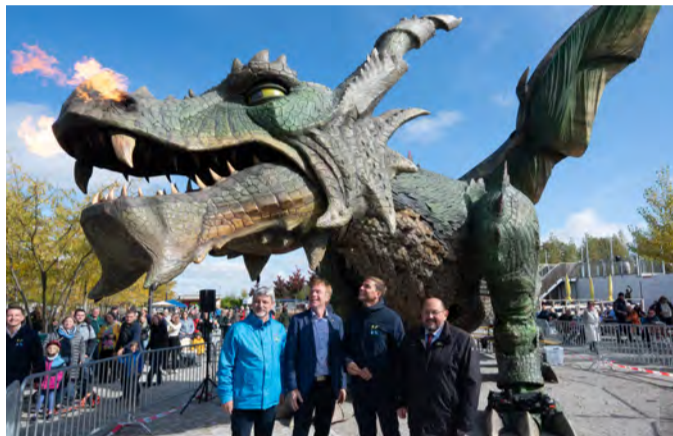
Drache "Fanny" ist nicht nur in Kirchheim ein Highlight, sondern auch im Guinness Buch der Rekorde als größter Schreitroboter der Welt.