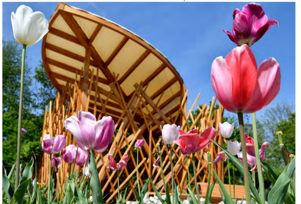
House of Nature