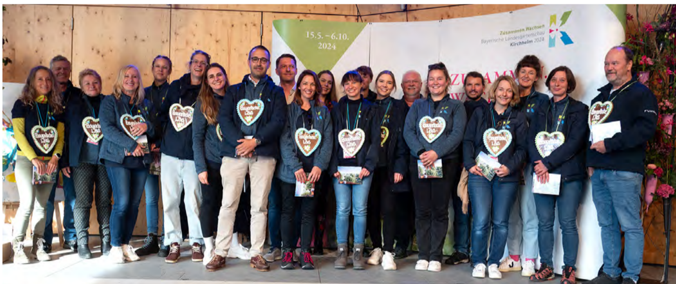
Danke an das LGS-Team für eine gelungene Landesgartenschau in Kirchheim 2024