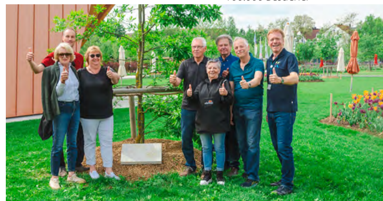
Partnerschaftsbesuch aus Boxdorf