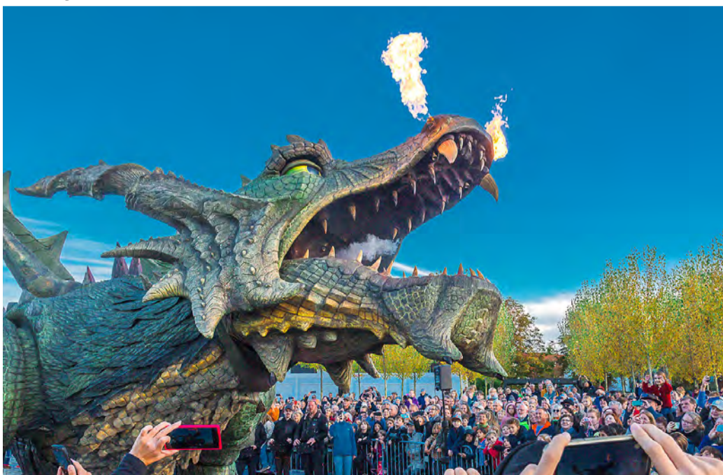
Wir freuen uns auf die LGS in Furth im Wald 2025 mit dem feuerspeienden Maskottchen Fanny