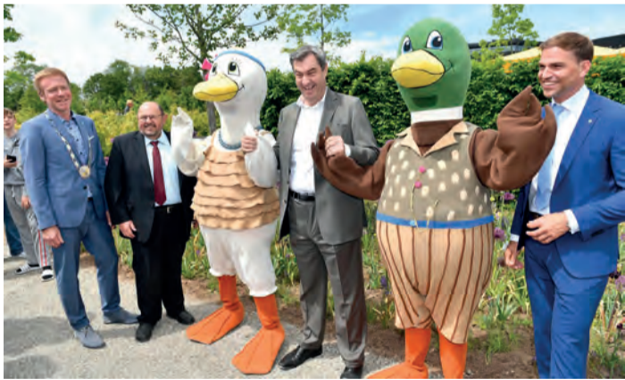
Eröffnung 15. Mai 2024