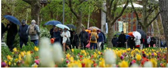
Leider gab es auch viel Regen