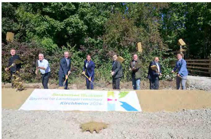
Spatenstich am 23.09.2021