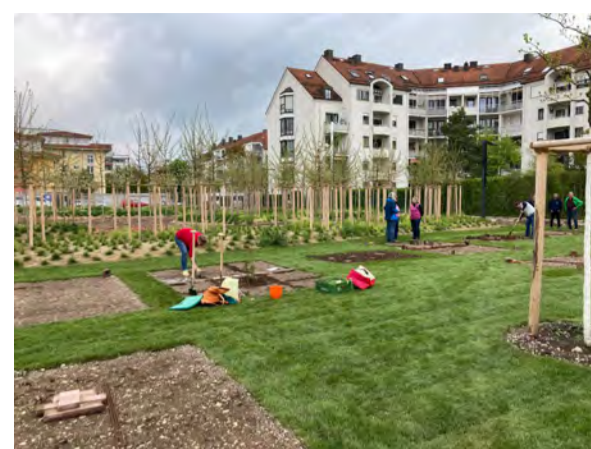
Angarteln in den Bürgergärten 2023