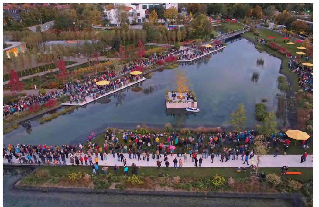
Abschlusskonzert 6. Oktober 2024 - Schee war's und auch ein bisschen emotional