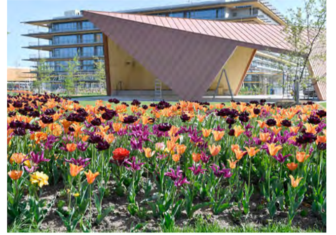
Blütenmeer vor dem Parkpavillon